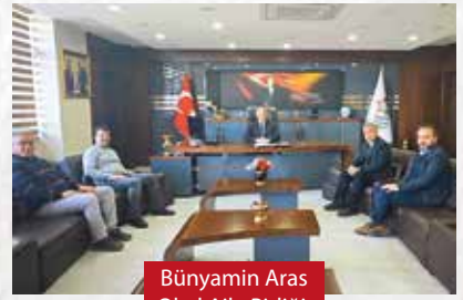
Bünyamin Aras Okul Aile Birliği