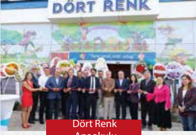
Dört Renk Anaokulu