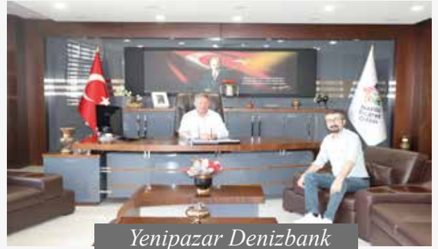
Yenipazar Denizbank Şube Müdürü